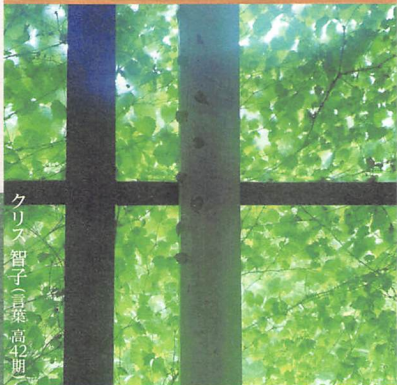
クリス 智子(豆菓 高42期)