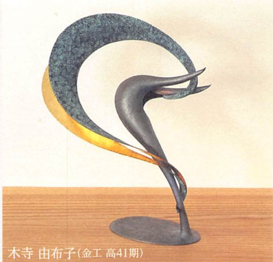
木寺 由布子(金工 高41期)