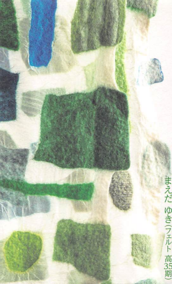
まえだ ゆき(フェルト 高35期)