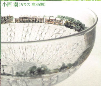
小西 潮(ガラス 高35期)